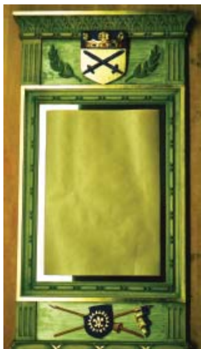
Spegel dekorerad med Rehbanders vapensköld. Nedtill syns därtill vapnets hjälmprydnad framställd på en sköld.

T. A. TRÄSKÄRNINGAR ANHALTSVÄGEN 12 SE-543 94 TIBRO