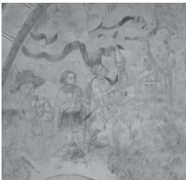
Bild 1. Avbildning av medlemmar ur sparresläkten. Lägg märke till vapenmålningen (skadad) nedanför till höger om riddaren.

Några kilometer norr om Ellinge slott finns, numera i utkanten av Eslöv, på en monumental höjd Västra Sallerups kyrka. Kyrkan byggdes under 1100-talet och slottet, med byggnader från 1500-talet och senare, har föregåtts av en medeltida huvudgård med ett omfattande gods. 1 Mellan kyrkan och huvudgården fanns – och finns på sitt sätt än idag – en intim koppling. I samband med en restaurering av kyrkan 1946–1951 togs medeltida målningar fram, däribland ett antal vapensköldar representerande Ellinges medeltida ägare. Målningarna beskrevs av Monica Rydbeck . 2 En konservering av målningarna 1975 3 föranledde Jan Raneke att närmare undersöka och ytterligare beskriva vapensköldarna. I flera fall har problem med att kunna koppla sköldarna till enskilda personer visat sig tämligen stora. Ranekes beskrivningar och tolkningar bygger därför i ganska hög grad på antaganden och hypoteser, vilket han själv också påpekar. 4 Jag menar ändå att grund finns för att omtolka av