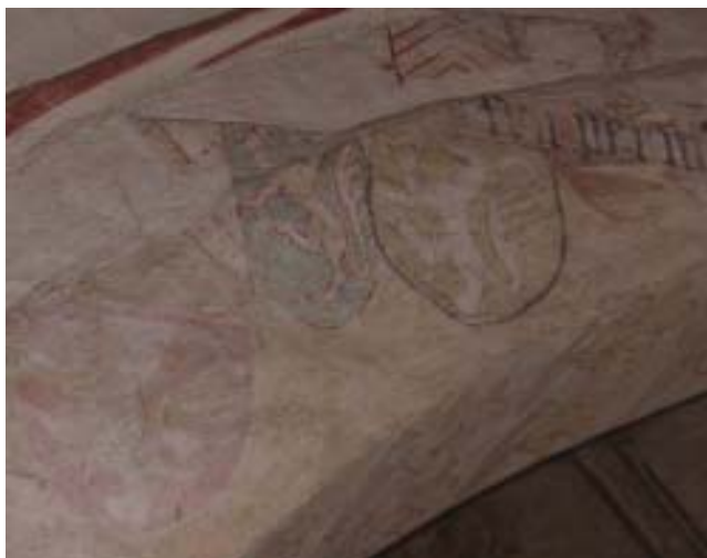
Bild 2. Överst till höger syns inskriften "fru pernilla", antagligen syftande på Niels Svendsens bustru Pernille Pedersdatter (Thott). Kring hennes sköld är ett par sköldar målade vars ägare är oklara.

Bilden på den norra korväggen innehåller en vapensköld, placerad omedelbart under de avbildade personerna. Dessvärre syns numera endast sköldens konturer och en hjälm med hjälmprydnad. Prydnaden innehöll ursprungligen buffelhorn med vippor eller