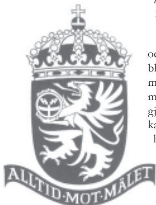
Vapen för Flygvapnets stridslednings- och luftbevakningsskola från 1994.

och utomlands, bland annat kan man se den mosaikfris han gjort i Mariakapellet i Söderledskyrkan i