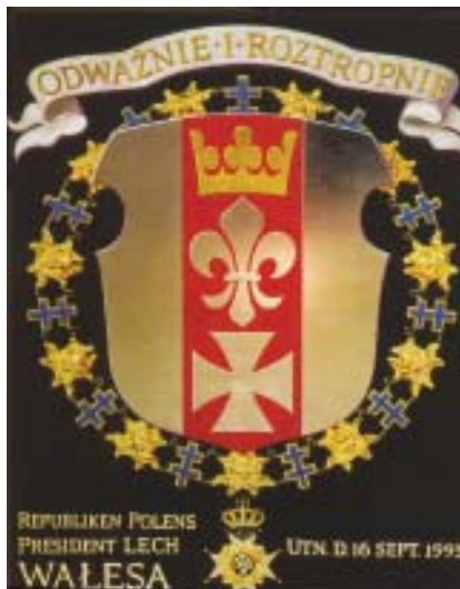
Serafimervapenskölden för Polens president Lech Walesa. Målningen gjordes 1995.