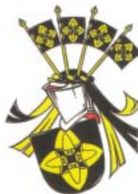
Kälde's eget släktvapen. Teckning från 1952.

för alla biskopar i Svenska kyrkan. Även ett stort antal utländska biskopsvapen i framför allt Afrika har Kälde som upphovsman. Här kan man också läsa om det förmodligen första offentliga vapnet som Kälde skapade, nämligen det för Katedralskolan i Uppsala antaget hösten 1954. Kälde var då gymnasist vid skolan.